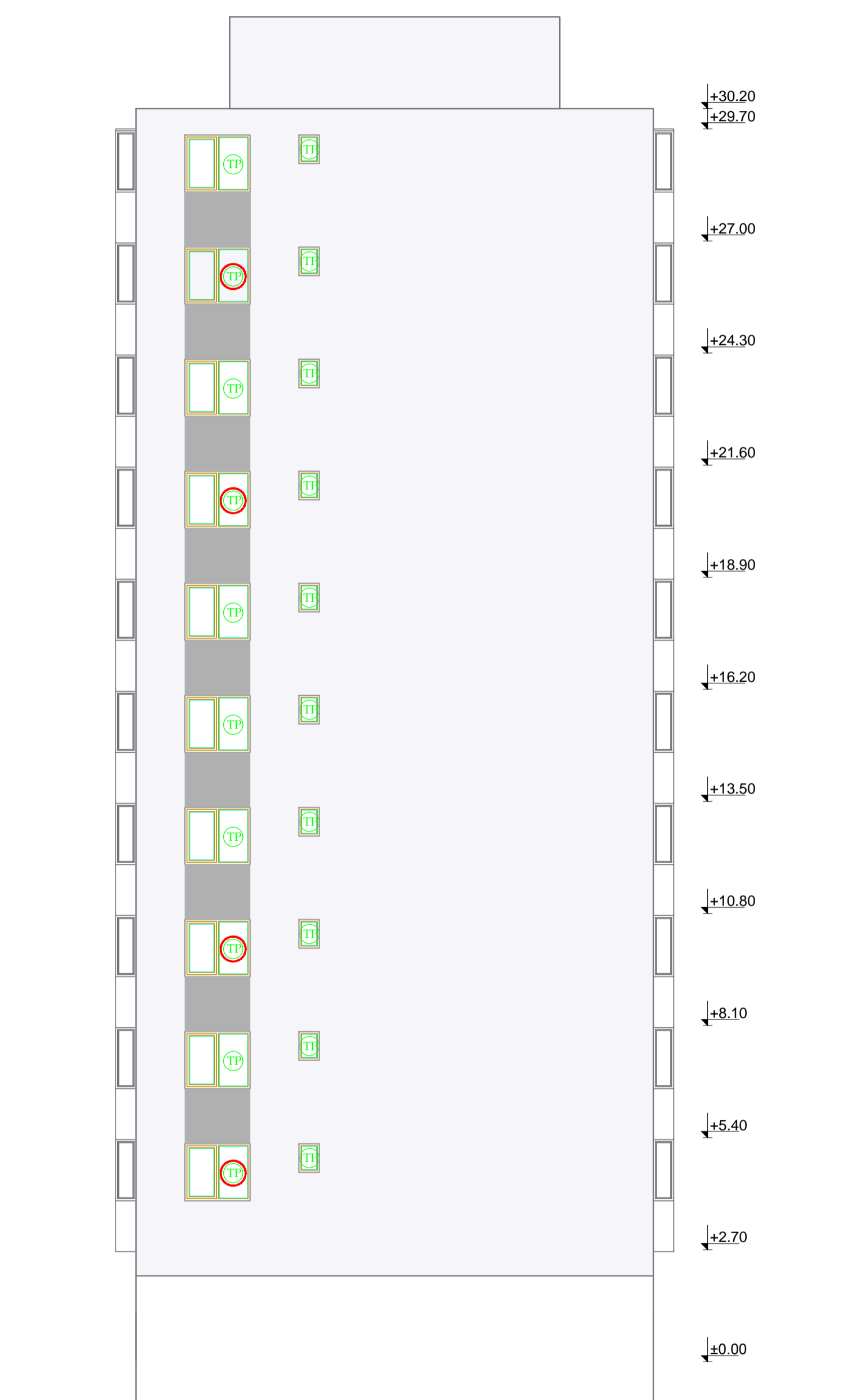
FATADA LATERALA DREAPTA propusa